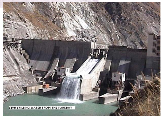
SJVN DÉVERSANT DE L'EAU DEPUIS LE BASSIN D'ADMISSION